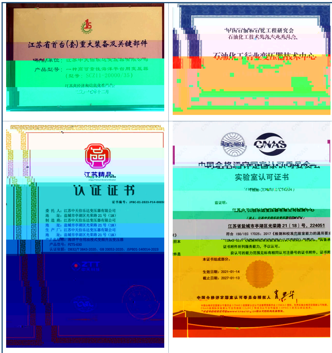
图 4.1 公司技术创新荣誉